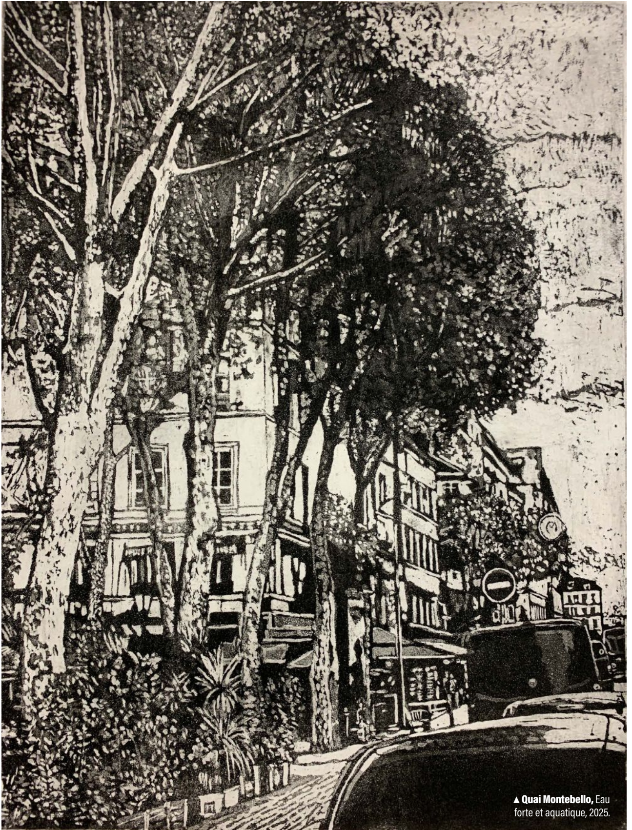
▲ Quai Montebello, Eau forte et aquarelle, 2025.