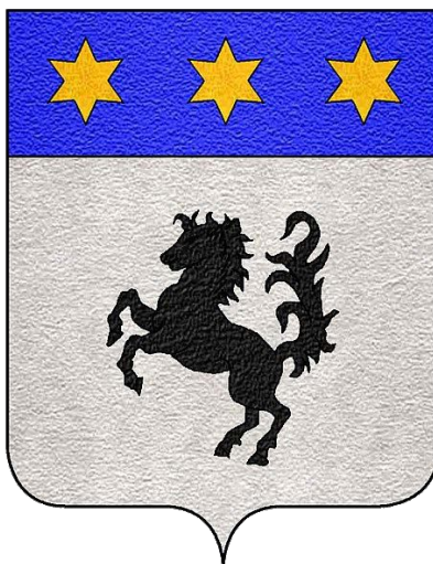
◀ Blason de la famille Baracca.

Ce blason s'inspirait sans doute des armoiries de la famille Baracca et du Piemonte Reale, régiment de cavalerie où il avait fait ses premières